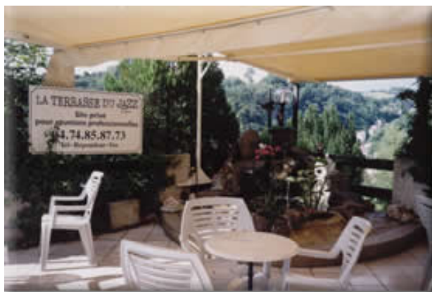
A votre disposition

Dominant le Théâtre Antique, cœur de cet événement culturel de réputation internationale qui anime toute la ville , notamment de fin juin à mi-juillet.