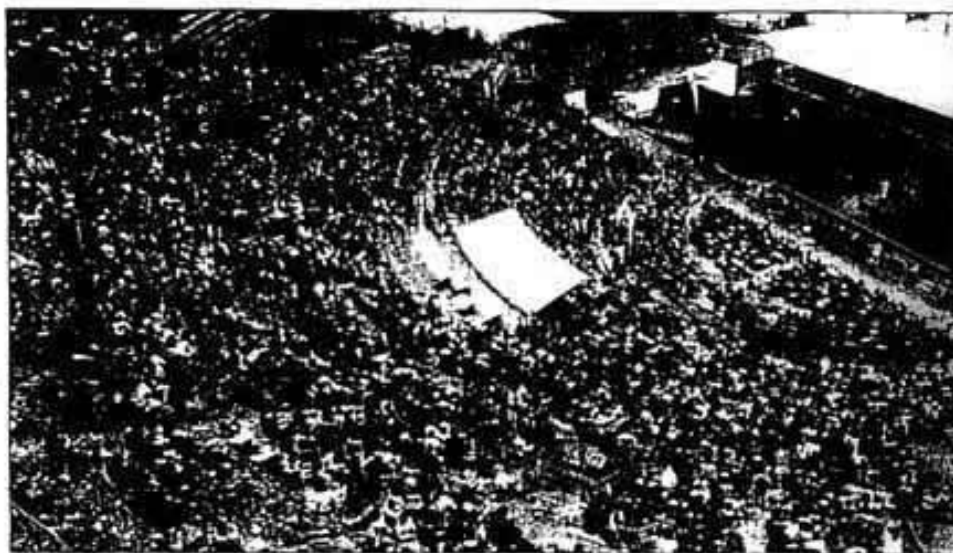
Une vue imprenable sur le théâtre antique...

Tout commence il y a 20 ans. G. R. habite Lyon et cherche une maison à la campagne. Il aime les vieilles pierres et plus la demeure sera ancienne, plus son bonheur sera grand. Contacts pris, un marchand de bien viennois l'appelle : «J'ai trouvé quelque chose pour vous. Une vieille maison située à