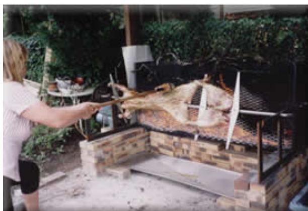
Le mechoui (2 moutons)