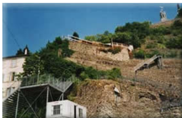
Site unique, vue imprenable