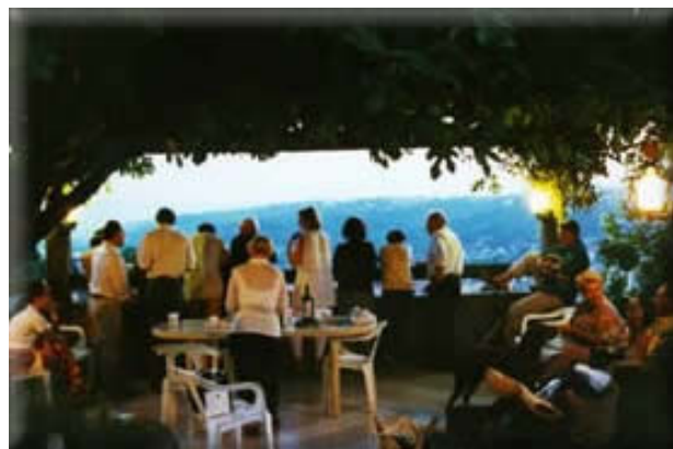
Du 1er juin à la fin août