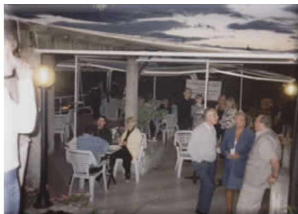
Un lieu de convivialité couvert