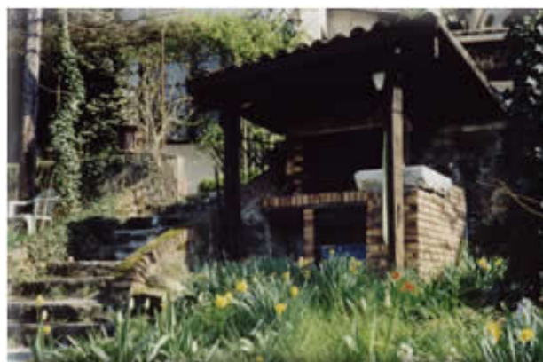
Un grand barbecue

Approche " live " des évènements se déroulant dans le théâtre Antique et vue imprenable sur la vallée du Rhône et Vienne.