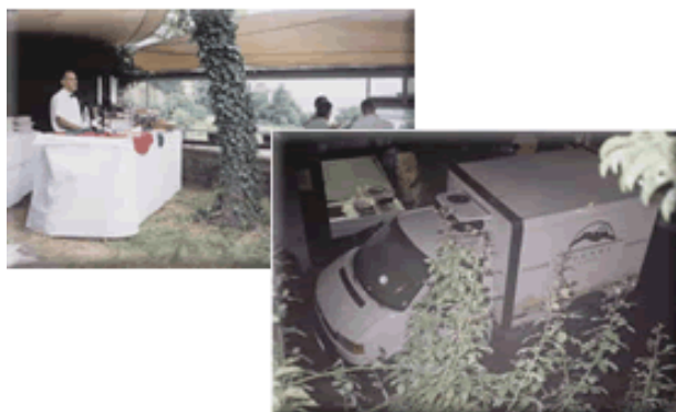
Toutes facilités pour traiteur

Visite du site sur rendez-vous. Tél : 06 12 36 49 46