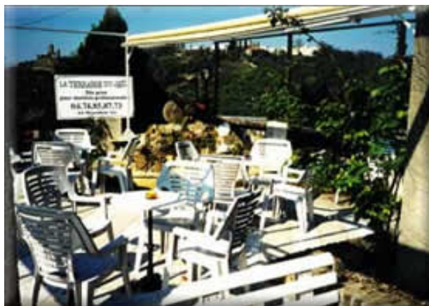
Un équipement complet